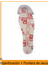
Antiperforación + Puntera de seguridad

Puntera polímero* Plantilla antiperforación textil*