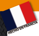
BOTA TST SA 10kV

LÍDER EUROPEO EN FABRICACIÓN DE CALZADO Y BOTAS PARA ALTO RIESGO.