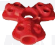
BAN-Q01 1/4", 3/8", 1/2" mm