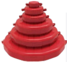
BAN-F11 1" - 2 1/2"