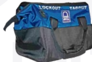
BAN-T28-1 320X230X280 mm