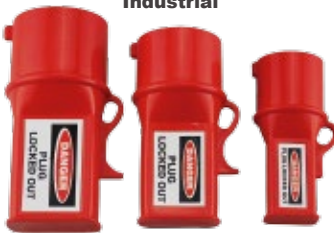
BAN-D47XL 63 Amp.