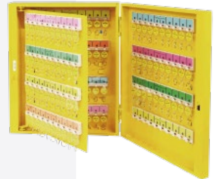
BAN-X72 160 Llaves 500X420X110 mm