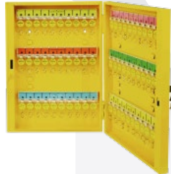
BAN-X72 60 Llaves 500X375X62 mm