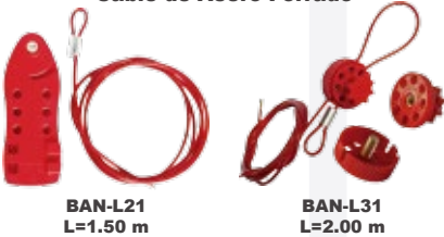
BAN-L21 L=1.50 m