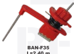
BAN-F35 L=2.40 m